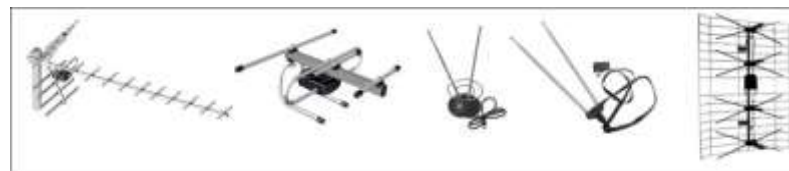
Рис. 3. Антенны для приема цифрового сигнала

К приставке подключается антенна. Специальная антенна для этого не нужна. Возможно использование той антенны, которая была установлена для просмотра аналогового телевидения. Также будет работать любая дециметровая антенна. (см. рис. 3).