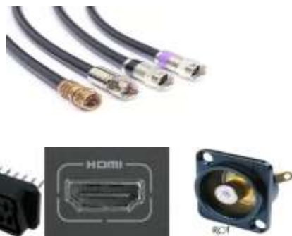
Рис. 5. Типы телевизионных разъемов

HDMI (возможно «SCART» или «RCA» в зависимости от модели телевизора, см. рис. 5).